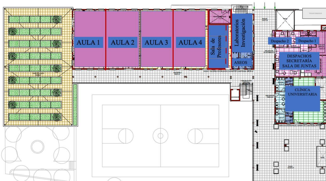
Figura 2.- Distribución de espacios Planta 1.

Los cuatro despachos, con un total de 16 puestos, facilitarán la posibilidad de realizar tutorías. A ellos se les une 3 despachos más y la posibilidad de utilizar la Sala de Juntas. FISIDEC dispondrá del Sistema “Cisco Webex Meetings” y “Teams” que permitirá la realización, si es necesario, de tutorías “on line” o modalidad “no presencial”.