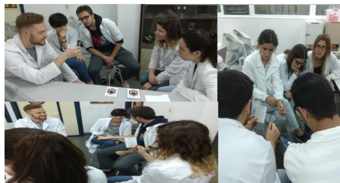
Imagen N° 2: Grupos de estudiantes de la modalidad bilingüe participando en el juego.

Ciento veinticuatro estudiantes han participado en el juego (Imagen N° 2) y contestado a una encuesta elaborada por el personal docente. Dicha encuesta consta de 5 preguntas con una escala de tipo Likert de 4 opciones de respuesta (“nada de acuerdo”, “poco de acuerdo”, “de acuerdo” y “muy de acuerdo”) mediante las que se pretende valorar competencias como: trabajo en equipo, toma de decisiones y análisis de la información. De la participación de los alumnos en la misma se desprenden los siguientes resultados: el 86% manifiesta que el juego permite aplicar los conocimientos adquiridos para resolver un caso práctico mientras que el 95% y 98% consideran que el recurso docente permite desarrollar la capacidad de análisis y estimula la motivación por el aprendizaje, respectivamente. Asimismo, el 96% opina que el juego estimula el trabajo en equipo y el 92% cree que permite afianzar de mejor manera los conocimientos adquiridos. Aunque el grupo de estudiantes que han utilizado el juego en su versión en inglés ( n: 10 ) ha sido muy inferior respecto de aquellos que lo han hecho en su versión en castellano ( n: 114 ), no hemos observado diferencias significativas en el nivel de valoración del juego.